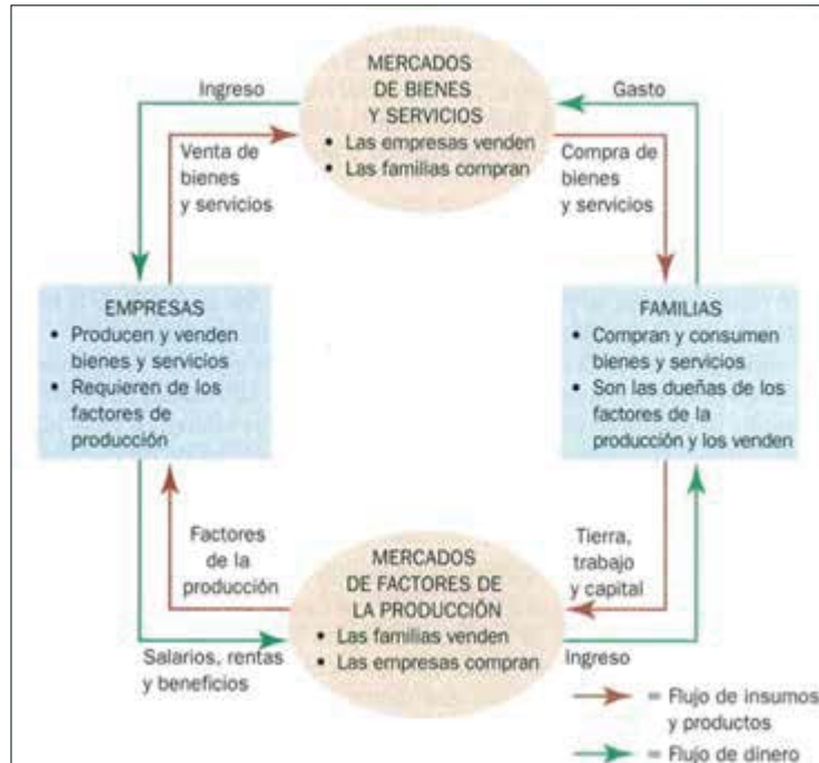
Figura1. La visió convencional de l'economia